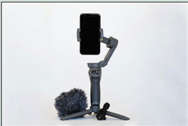
Pack Ultra Mobile