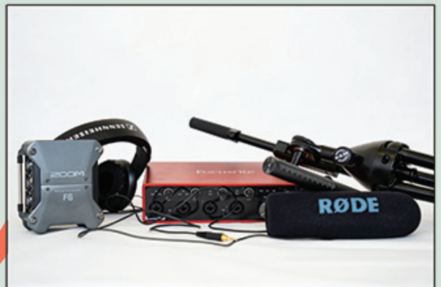
Studio Radio Mobile