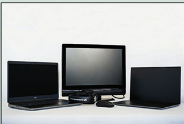
Station Montage Vidéo